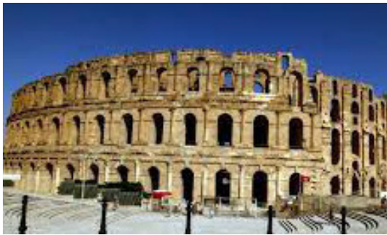
L'amphithéâtre romain d'El Djem