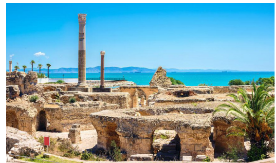
Site archéologique de Carthage