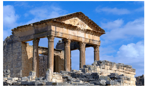
Dougga / Thugga