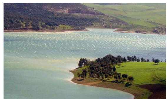
Parc National d'Ichkeul