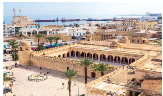
Médina de Sousse