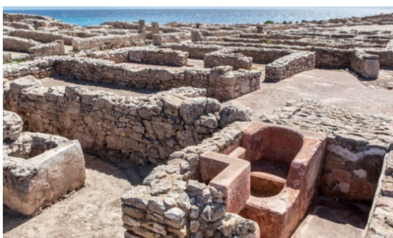
Cité punique de Kerkouane