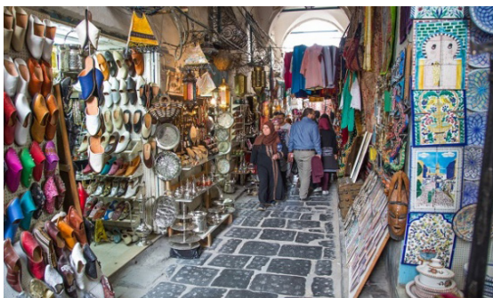
Médina de Tunis